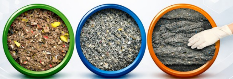
Processed Output from Hospital Waste Treatment